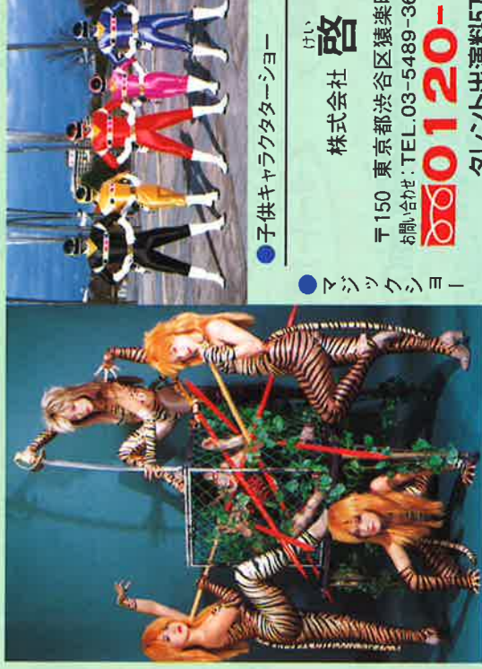
子供キャラクターショー