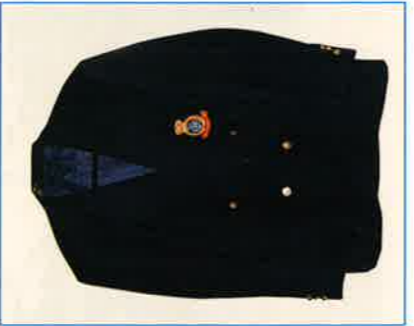
青年部会ブレザー

品ある(センスの良い)色とデザインで、若き経営者の象徴のような胸に輝くエンブレムと共に