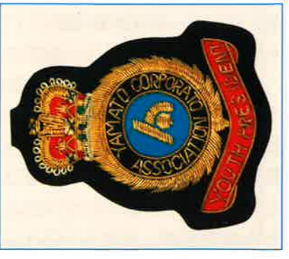
青年部会エンブレム

催という大事業がございました。顧みますと、青年部会は創立以来多くの人材に恵まれて前進を続け、会員数も年々大幅に増員され、その事業内容もまた確実に充実して参りました。これも偏に役員をはじめ部会員皆様のためまぬ努力の賜と心から敬意を表するものであります。 皆様は現在でも(株)大和法人会の幹部の一員として、会の運営に関与しておられますが、近い将来には皆様が(株)大和法人会を運営する立場に立たれるこ