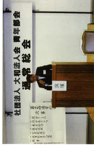
社団法人 大和法人会 青年部会 通常総会