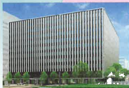
《東京国税局新庁舎》